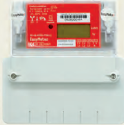
Ausführung als Zweirichtungszähler und Lieferzähler

wesernetz Bremen GmbH Theodor-Heuss-Allee 20 28215 Bremen